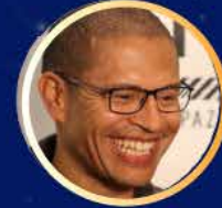
🏆 Alex de Souza